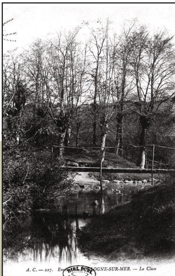
A. C. — 227. Environs de BOULOGNE-SUR-MER. — La Cluse