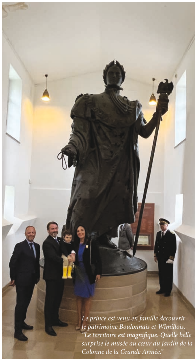
Le prince est venu en famille découvrir le patrimoine Boulonnais et Wimillois. "Le territoire est magnifique. Quelle belle surprise le musée au cœur du jardin de la Colonne de la Grande Armée."